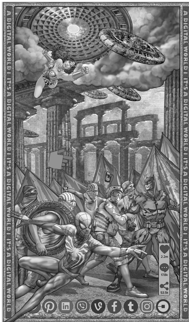
It's a Digital World 3 (2021), Digital collage, Jacquard woven tapestry, 310 x 185 cm

With her media tapestries, Margret Eicher refers directly to the function and effect of the historical tapestry of the 17th century. Since the Middle Ages, tapestries have served representative and political purposes like hardly any other visual medium. In the Baroque era, however, the courtly tapestry unfolded and optimized its functions in the representation of power, in ideological communication and propaganda. If one compares functions of the baroque communication medium with those of contemporary mass media, astonishing parallels emerge. Manipulation of the viewer and philosophical reflection on life stand side by side in a value-neutral manner. Although in the courtly context the propagandistic dispersion and thus the circle of