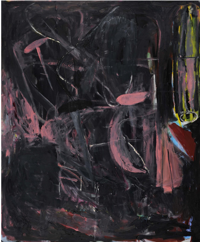
Einszweidreivier (2021), Oil on canvas, 140 x 120 cm