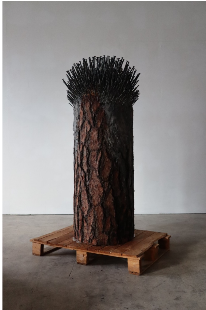
Kunstpranger (2008), Tree trunk and nails on wooden pallet, 153 x 73 x 70cm